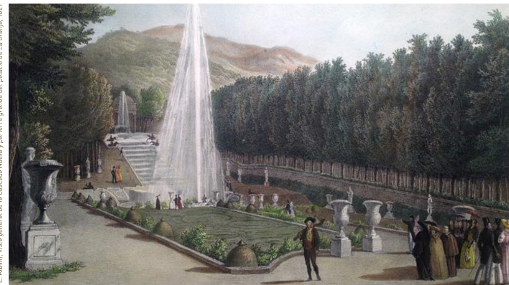
Fernando Brambilla (litografiado por L. Albin). Vista general de la Cascada Nueva y parterre grande del palacio de La Granja, 1821